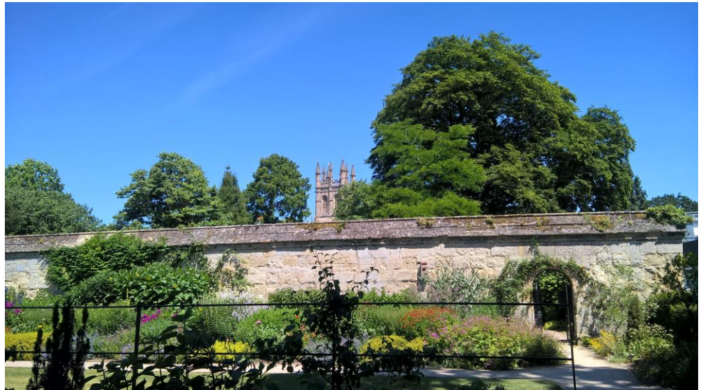
Oxford Botanic Garden

mit Besuch der RHS Hampton Court Palace Flower Show