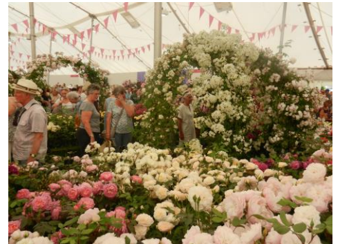
RHS Hampton Court Flower Show