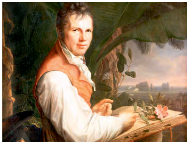
Alexander von Humboldt

Ausstellung „Forscher Sammler Pflanzenjäger“ vom 14. Juni bis 15. September 2019 in den Botanischen Gärten.