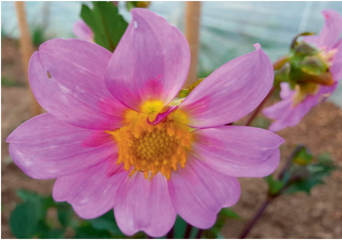
Dahlia sherfii, eine der Wildarten aus Mexiko

1803 brachte dann Alexander von Humboldt eine gelb-orangene Dahlien-Wildart mit. Durch Kreuzungen mit deren Samen begann die Ausbreitung der